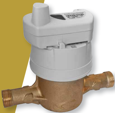
> EverBlu Cyble Enhanced nameščen na stanovanjskem vodnem števcu